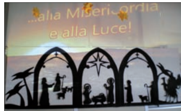
Circolo San Michele (Angiari) - Classe 5ª della scuola primaria, anni 10