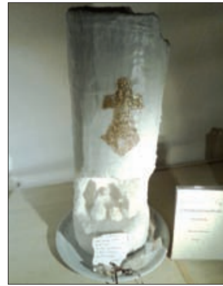
Circolo Arcobaleno San Vito (Cerea) Agostino Ballottin