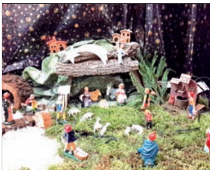
Circolo Noi (Monteforte d'Alpone) - Irene e Rachele Gallo, 5ª elementare