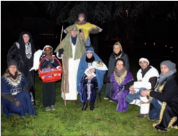
Centro Giovanile (Terranegra) Canto della Santa Notte parrocchiale