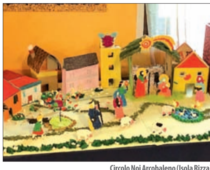
Circolo Noi Arcobaleno (Isola Rizza) Classe 5ª scuola primaria, anni 10