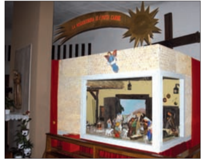
Centro Giovanile (Terranegra) - Presepe della chiesa