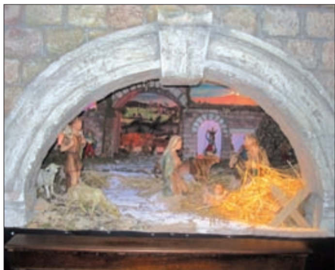
Circolo La Speranza (Roverchiara) - Gruppo chierichetti, anni 10