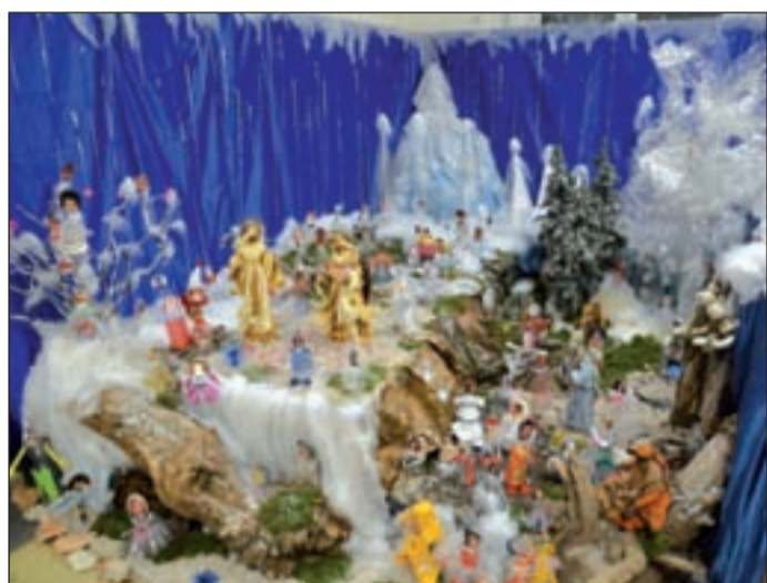
Circolo parrocchiale Casa Mia (Azzano di Castel d'Azzano) Scuola dell'infanzia don Ippolito