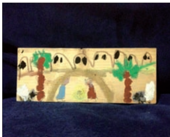
Casa della gioventù (Sanguinetto) - Eros Pizzolo, anni 5