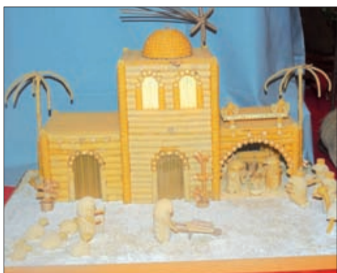
Circolo Noi5 (San Martino Buon Albergo) - Giordano Tambara