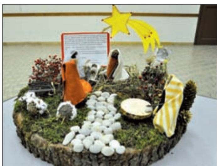
Circolo Noi San Pietro Martire (Balconi di Pescantina) scuola primaria, classi 3ª A e B, anni 8