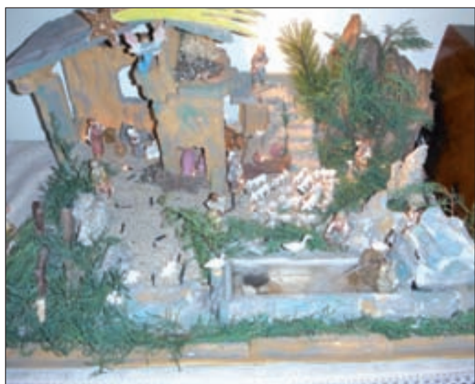
Circolo Noi (Monteforte d'Alpone) - Giulio Bianchini, 4ª elementare