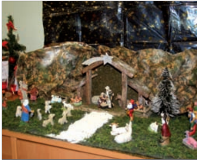
Centro Giovanile (Terranegra) - Associazione San Martino